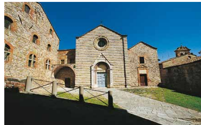
Lucignano, Chiesa di San Francesco

Although Second-World-War artillery severely damaged the main tower and walls of this castle built before the year 1000, Civitella remains one of the most typical examples of feudal architecture.