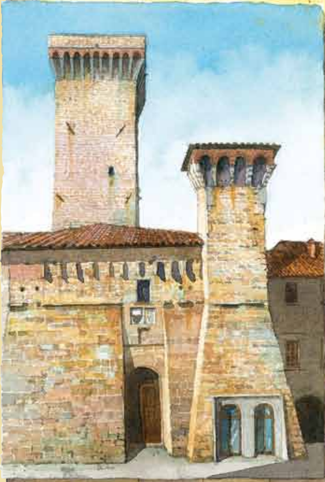
IL CASSERO TRECENTESCO